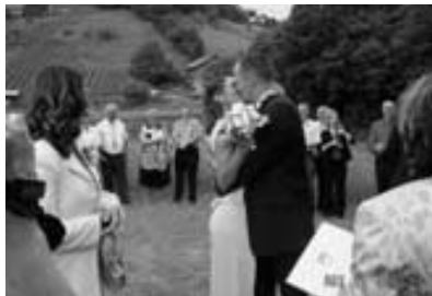
Obredni poljub ...

obredom in celotno poroko zelo zadovoljni. Med Damjanovimi svati je bil tudi Roko, vodja ansambla "Roko banda". Roko bi moral biti ob 19. uri na koncertu njegove