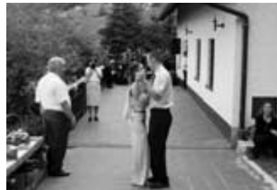
In na koncu ples.

Tudi na pikniku je bilo vreme prizanesljivo. Deževati in bliskati se je sicer začelo prej, že ob 20. uri.