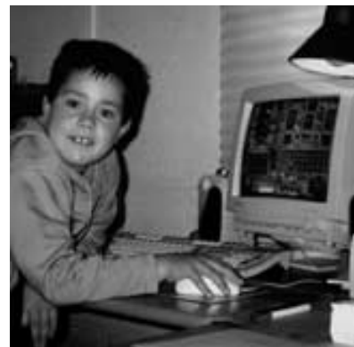
Svit ob ustvarjanju pravljice

Dojenček je padel mami v naročje. Štorcljo je še brcnila s praga na cesto, takrat je pa ravno pripeljal po cesti avto in štorcljo povozil. Ko se je štorclja zbudila, polna samih ran, je komaj poletela in šla domov. Vsako minuto je padla na tla in komaj spet vstala in poletela. Prišla je domov in videla pregrde poglede drugih štorclj. Štorclja se je začudila in rekla: "Se je kaj zgodilo, ko me ni bilo, povejte, kaj se je zgodilo?" "To bi morala vedeti sama. Izvedele smo, kaj si naredila. Osramotila si nas! Pojdi in