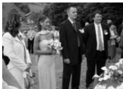
Nevesta, ženin in priči med obredom

Opisani in predvideni scenarij je bil tudi izveden. Svatje, ki jih je bilo več kot 120 (prišli so vsi objavljene in še nekaj več) so bili z