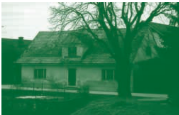
Brod 10, marec 2002

Hiša je imela dva vhoda, dvoriščnega in cestnega. Njeni prebivalci so večino časa preživeli v kuhinji, v kateri je bila tudi jedilna miza z značilno klopjo. Za mizo se je vedno sedelo v točno določenem sedežnem