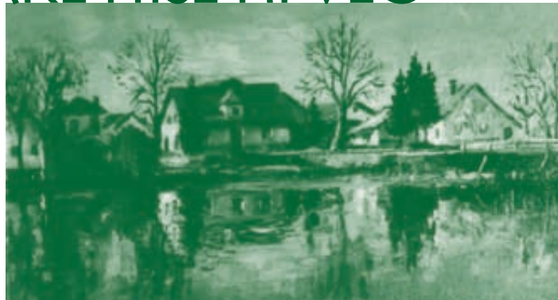
Domačija na Brodu

Velika hiša je bila hkrati spalnica in praznična