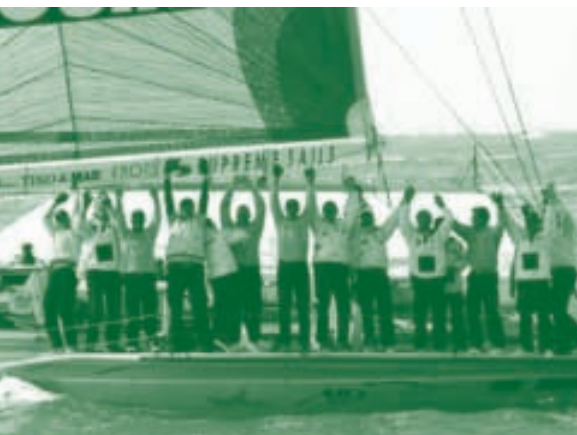
Ekipa pred startom