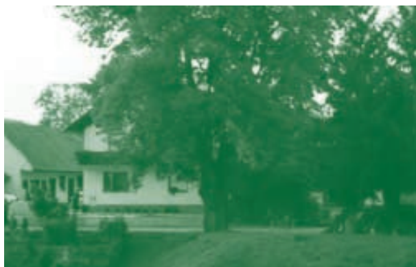
Brod 10, september 2002

V veliki hiši se je rodilo veliko naših sorodnikov. Prvi otrok Lojzeta in Antonije, rojen v tej sobi, kar