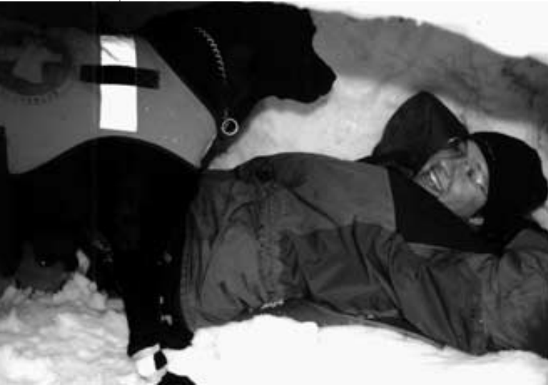
Črna in Alja

Po končanem začetnem šolanju sva z Miss opravili izpite za reševalnega psa in njegovega vodnika. Tudi vodnik mora biti namreč kondicijsko pripravljen in obvladati večšine, kot so orientacija, prva pomoč, vrvna