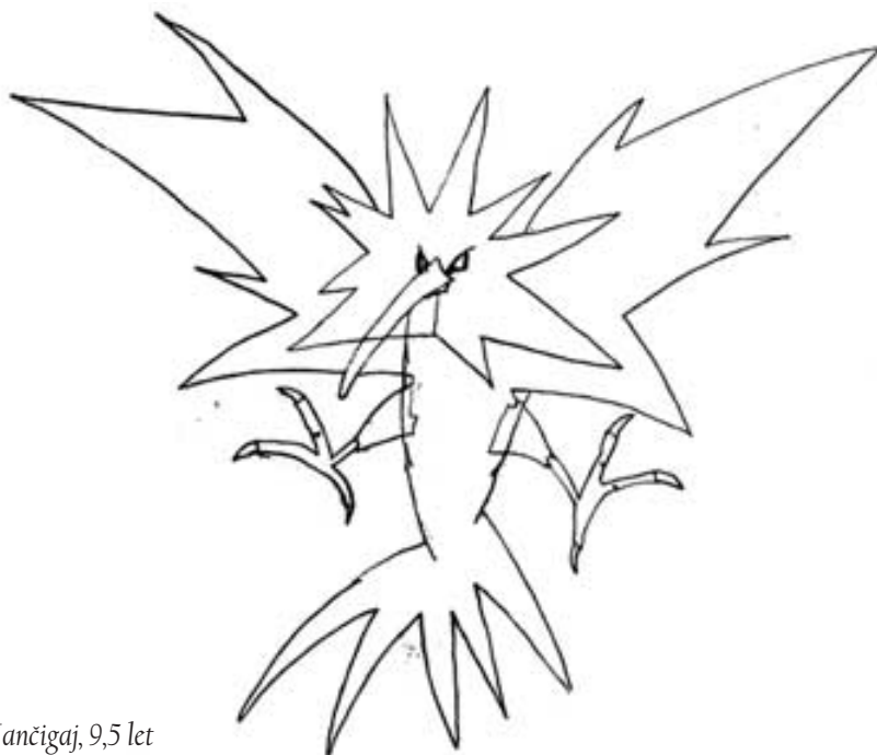
Figura iz igrice, Jan Jančigaj, 9,5 let