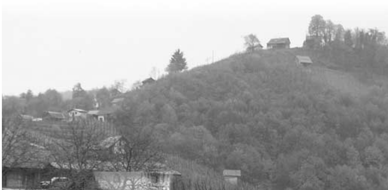
Planina (pogled z Banovca)