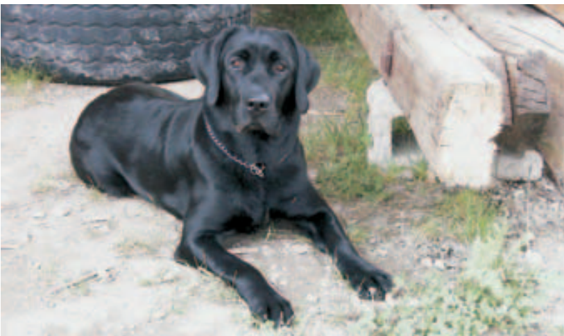
Črna počiva na treningu