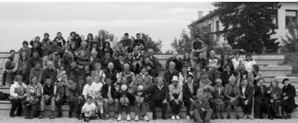
Skoraj vsi udeleženci piknika 2004

⊗ Zadnje novice Koncert pevskega zbora Lipa zelenela je