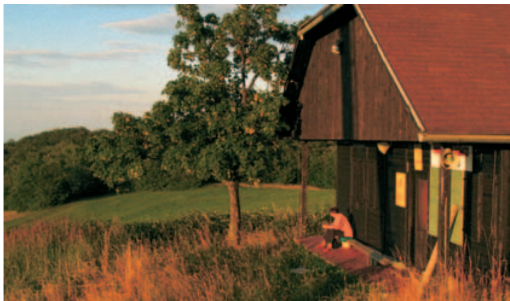
Poletni večer na Planini