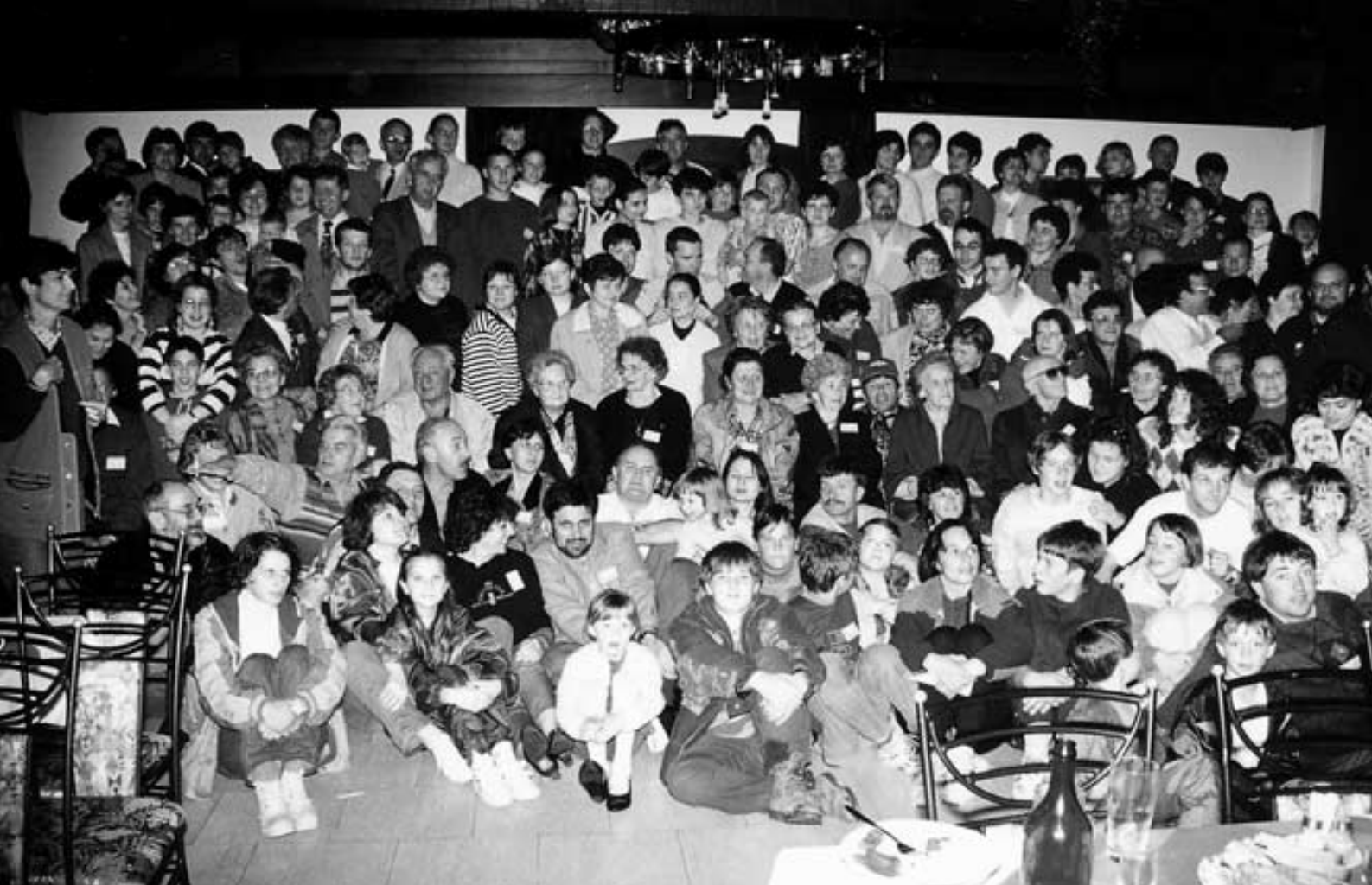
Prvo srečanje članov Društva Kerinov in Stritarjev leta 1995