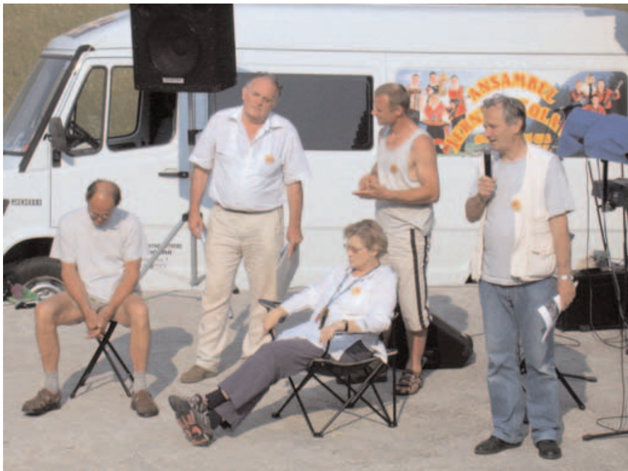
Delovno predsedstvo, zapisnikar in predsednik