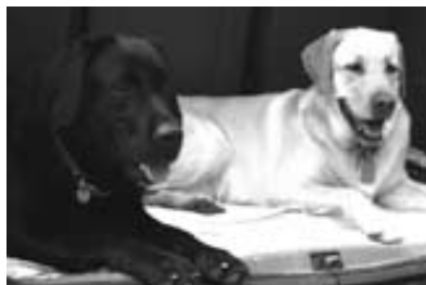
Črna in Ukica

Imela sem se super, saj sem se od Uke lahko marsičesa naučila. Ona je odlična psička reševalka.