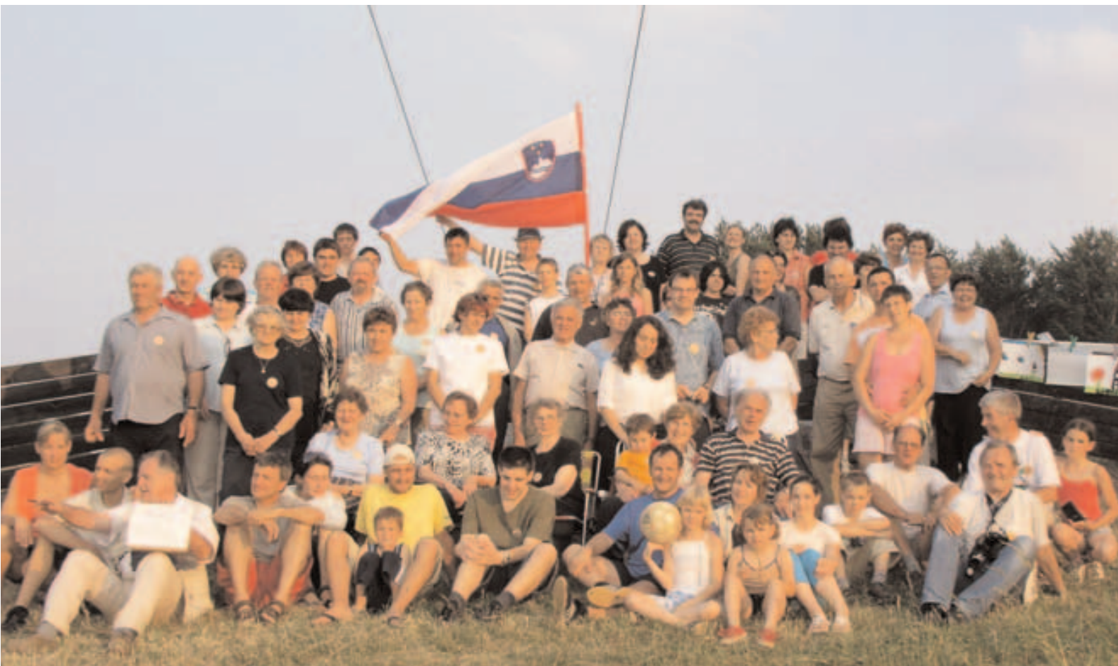
Udeleženci piknika na Planini pozirajo za "gasilsko fotografijo"