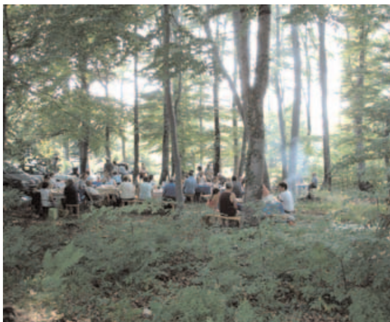
Gozd je bil varno zavetje za udeležence srečanja