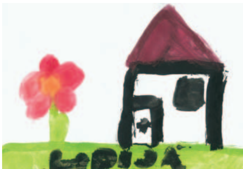
Lidija Simakovič, 7 let