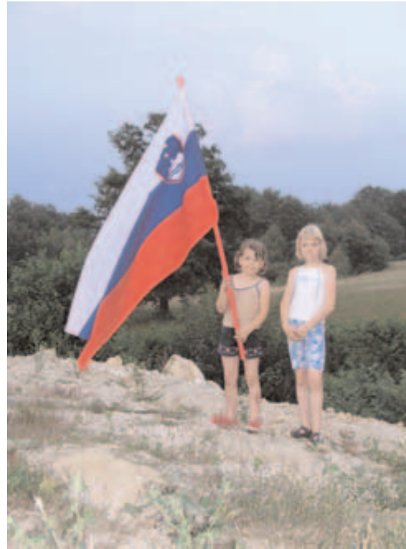
Planina na dan državnosti