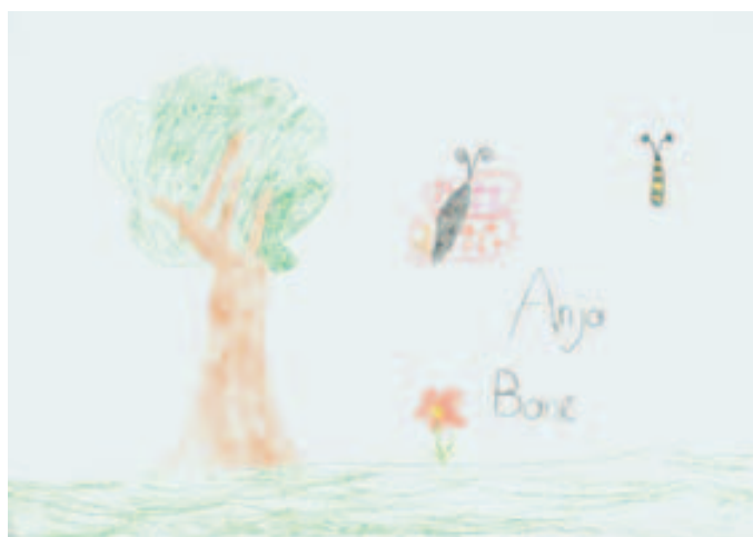
Anja Banič, 8 let