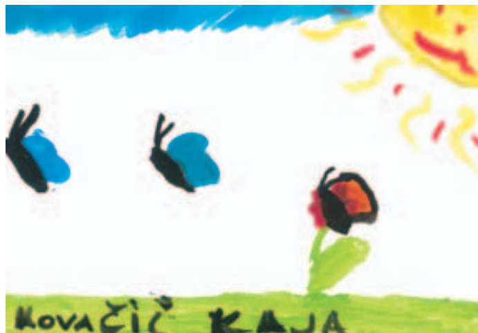
Kaja Kovačič, 8 let