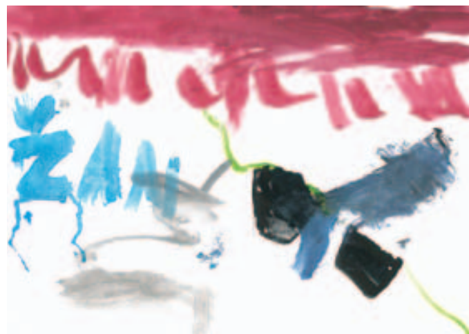
Žan Cuzak - Novak, 5 let