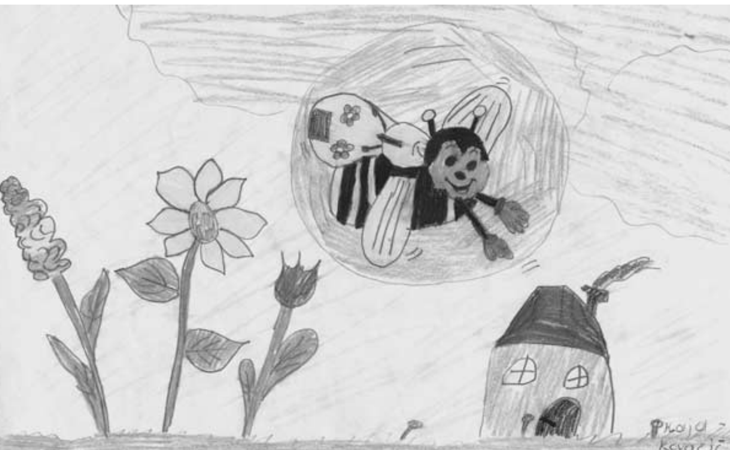
“Pomlad”, Kaja Kovačič, 8 let