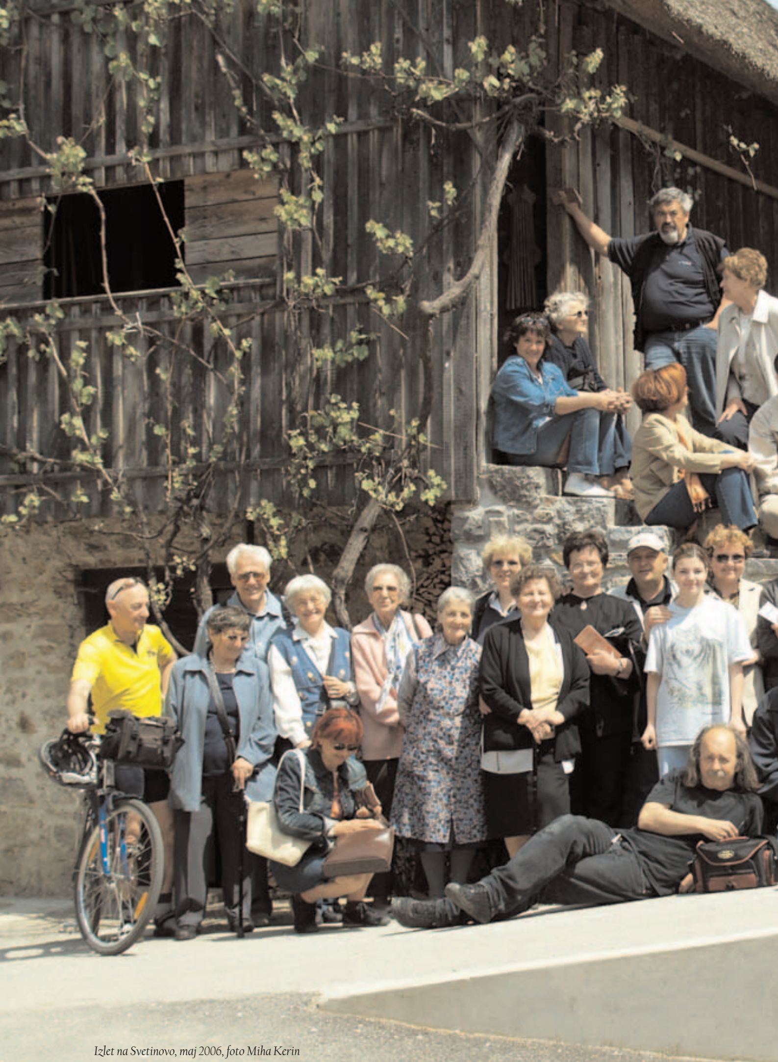
Izlet na Svetinovo, maj 2006