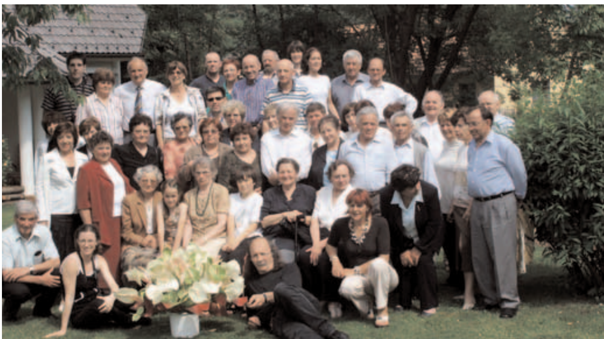
Skupinska slika s praznovanja v Podbočju