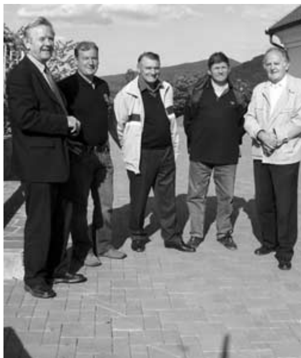
Organizatorji na prizorišču piknika

Dogovorili smo se za osnovne pogoje pri organizaciji piknika. Osnovni prostor bo zunanji plato nad kletjo, ker predvidevamo, da bo lepo vreme. Če se vremenska predvidevanja ne bodo uresničila, imamo za vse udeležence dovolj prostora znotraj.