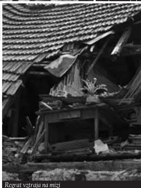
Regrat vztraja na mizi