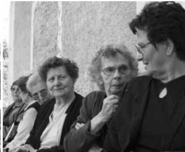
Gospe na klopi pred Stritarjevo domačijo