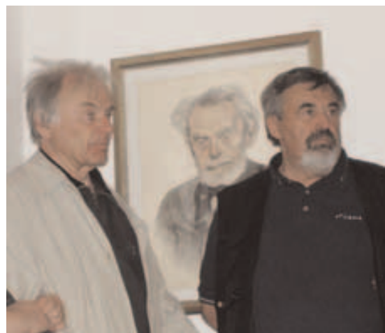
Trije Stritarji Janez (Banič), Josip in Simon (Perko)