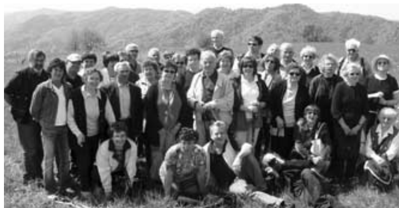
Skupinska fotografija na Velikem Osolniku