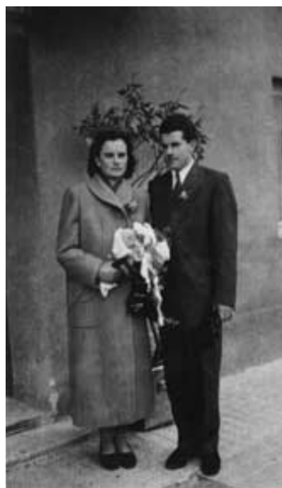
Poročna fotografija: Ljubezen je sreča, ki jo dajemo drug drugemu.