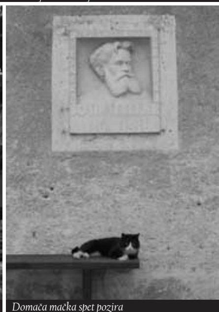
Domača mačka spet pozira