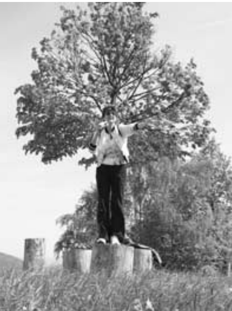
Alenčica se pripravlja na skupinski posnetek